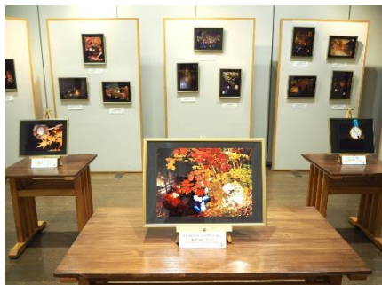
(昨年の会場の様子)

この秋ライトアップ期間中に開催したフォトコンテストの入賞作品、全15点を展示します。