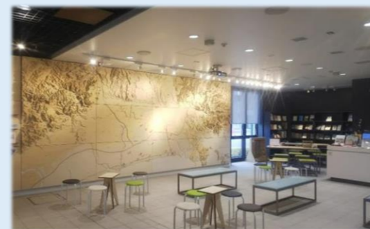
せんだい3.11メモリアル交流館