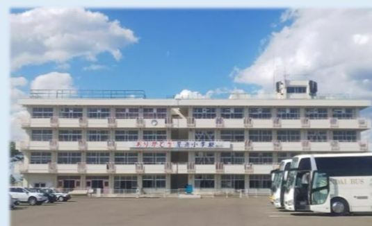
震災遺構 仙台市立荒浜小学校