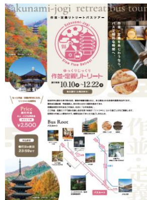
作並・定義 観光バスツアー