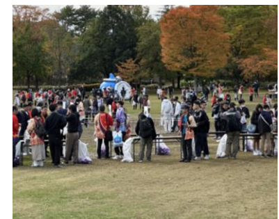
ドラゴンクエストウォーキング