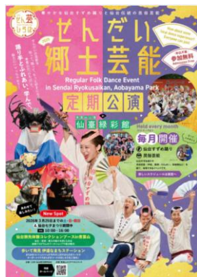
ぜんだいでい郷土芸能 ひろばin仙臺緑彩館