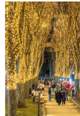
SENDAI光のページェント