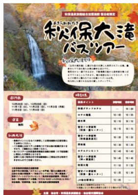
秋保大滝バスツアー