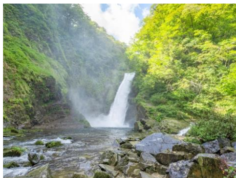
秋保大滝エリアの魅力向上