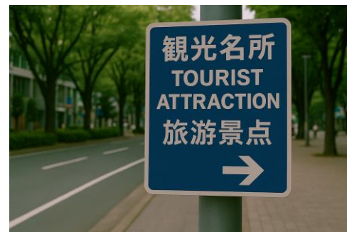
サイン整備(イメージ)