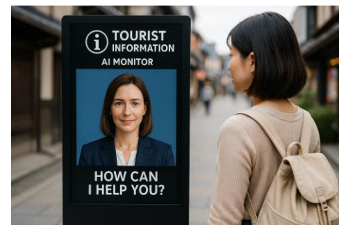
DXを活用した観光案内(イメージ)