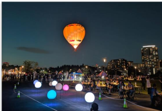
SENDAILルミナクト等 青葉山でのナイトイベント