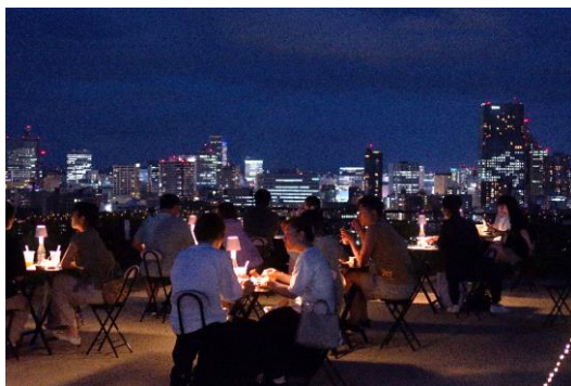
仙台城跡からの夜景を活かした ラウンジの設置