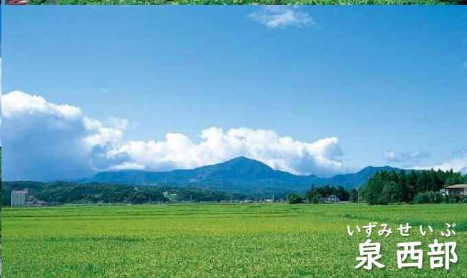
いずみ せい ぶ 泉 西部