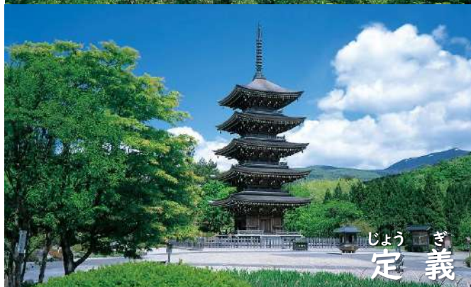
じょう ぎ 定 義