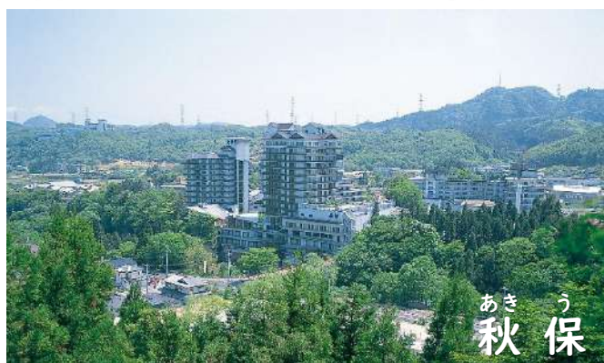
あき う 秋 保