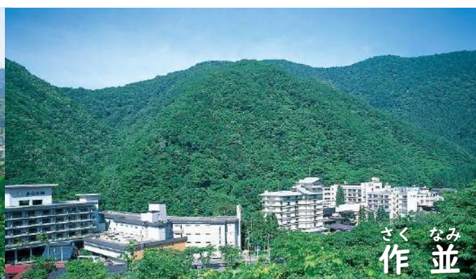
さく なみ 作 並